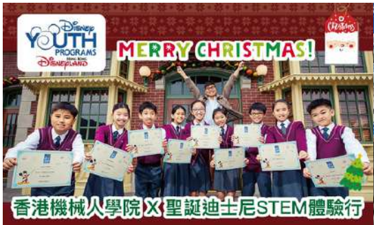
香港機械人學院 X 聖誕迪士尼STEM體驗行

香港機械人學院提供豐富多元的學習體驗，包括STEM 主題學院旅行、專業比賽訓練班及短期工作坊。活動旨在培養學生的科技素養、創造力及解決問題的能力，為未來科技領域的挑戰做好準備！